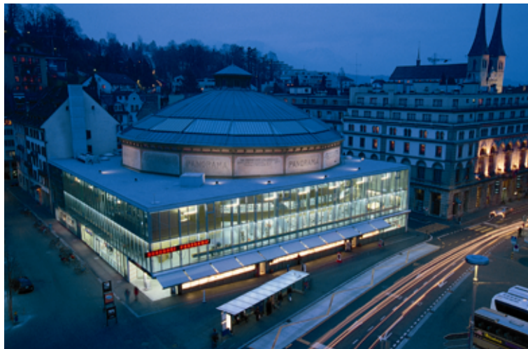
Abb. 19: Das Gebäude des Bourbaki Panorama nach dem Umbau von 1996-2000

Im Neubau der Zürcher Architekten Kreis Schaad Schaad, im Januar 2000 eröffnet, werden neben dem Bourbaki Panorama und dem neuen Museum die Stadtbibliothek, das stattkino, weitere kommerzielle Kinos, ein Restaurant sowie diverse Läden untergebracht.