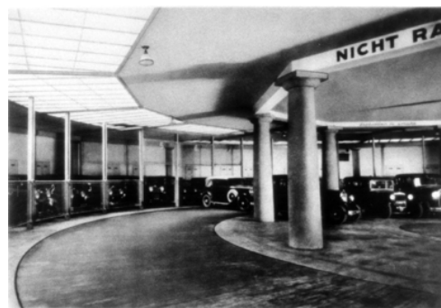
Abb. 17 und 18: Die Auto-Garage Koch um 1930