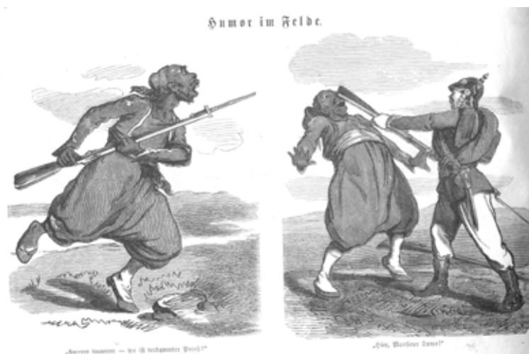
Abb. 1: Rassistische deutsche Karikatur aus der Kriegszeit – Ein Turco (Soldat aus den französischen Gebieten in Nordafrika) im Kampf mit einem Preussen

Russland halten sich daraufhin neutral, und Bismarck kann die bestehenden militärischen Beistandsbündnisse (Norddeutscher Bund und einzelne süd-deutsche Staaten wie Württemberg, Bayern, Baden) einfordern und damit sein nationales Ziel, ein „Kleindeutsches Reich“ (ohne Österreich) unter Preussens Führung erreichen. Mit dem Sieg der Deutschen wird auch die Grenzlinie zwischen Deutschland und Frankreich neu gezogen. Das besiegte Frankreich muss seine überwiegend deutschsprachigen Gebiete, das Elsass und einen Teil von Lothringen, (wieder) abtreten.